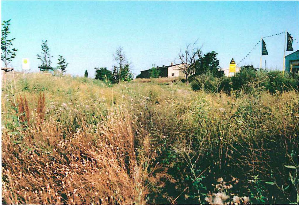
Abb. 9: Ruderalflur südlich der Tankstelle im Plangebiet