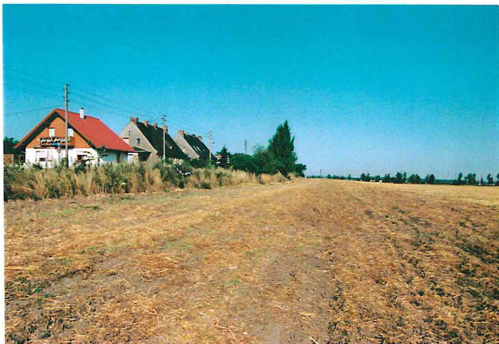
Abb. 10: Acker nördlich des Siedlungsbereiches der Gemeinde Ilberstedt außerhalb des Plangebietes - Standort für Ersatzmaßnahmen