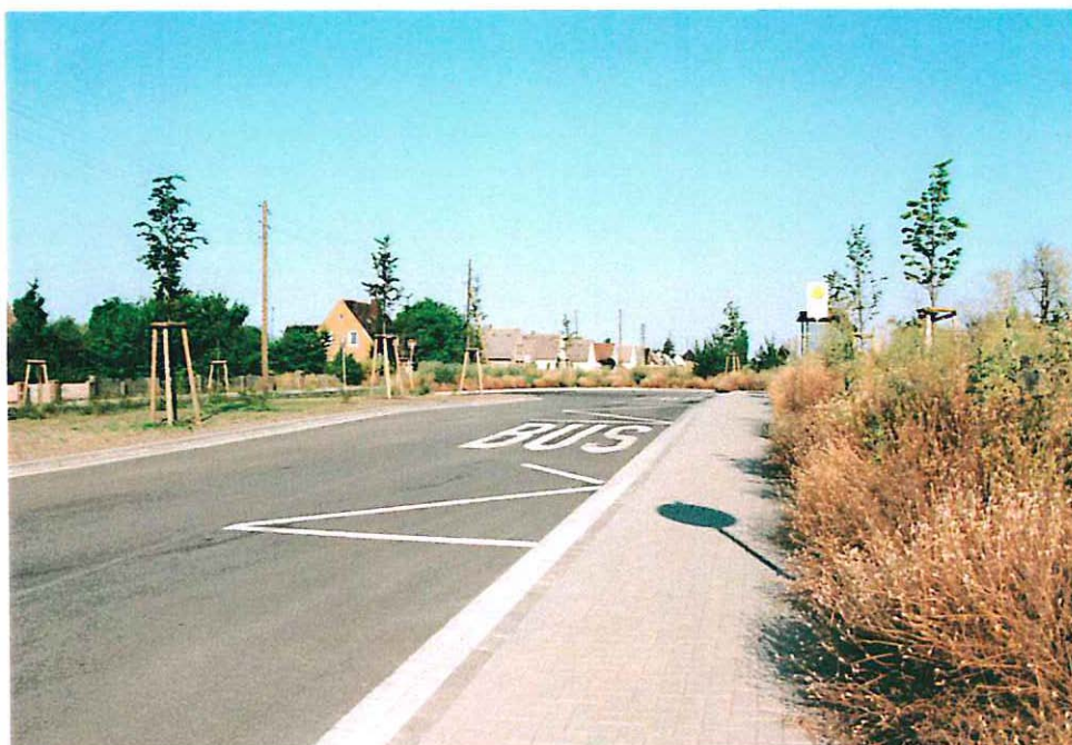
Abb. 7: Bushaltestelle mit Lindenanpflanzung im Plangebiet