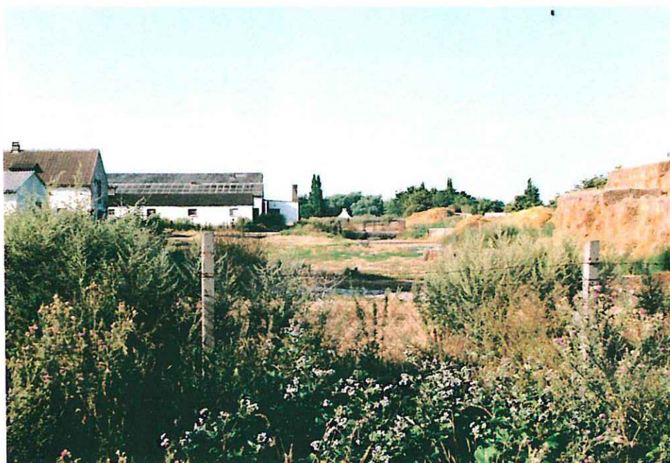
Abb. 8: Stallanlagen mit Ruderalfluren im Plangebiet