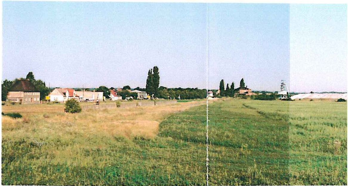
Abb. 1: Plangebiet südlicher Teil - Übersicht, Standpunkt westlich der Stalle