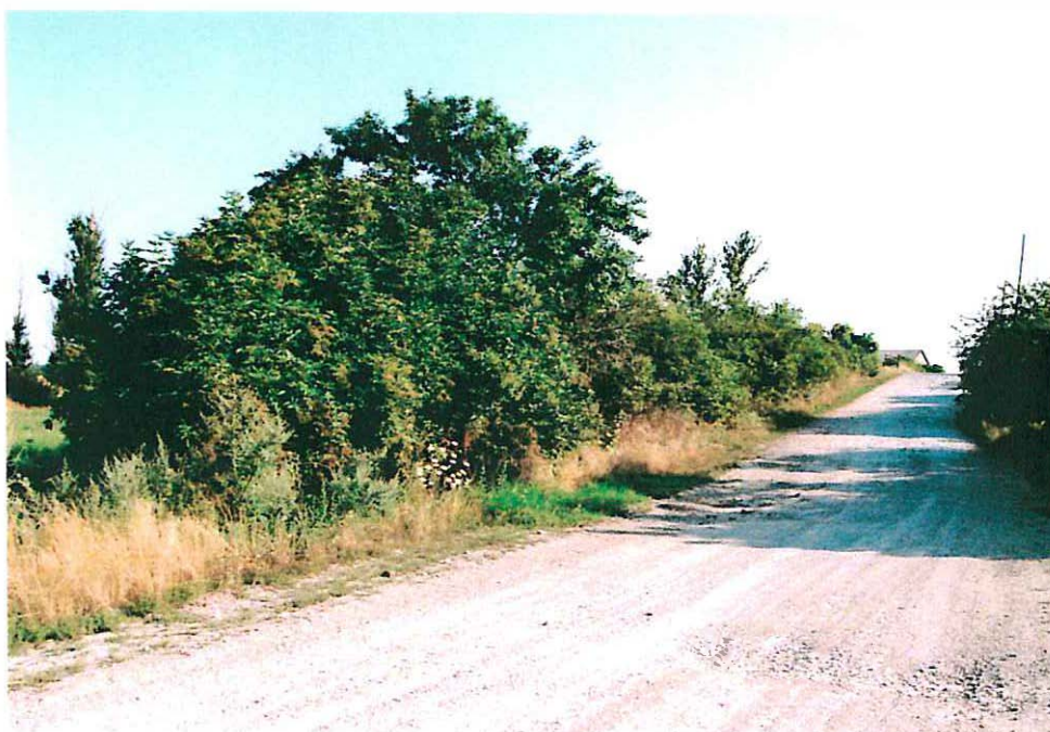
Abb. 5: Gebüchsaum am Feldweg Ilberstedt-Strenzfeld im Nordosten des Plangebietes