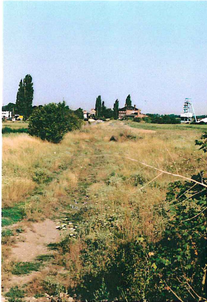
Abb. 3: Alter Bahndamm mit Saumgesellschaft im Plangebiet