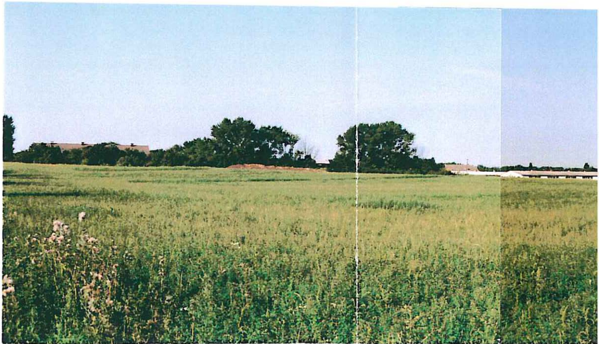
Abb. 2: Plangebiet nördlicher Teil - Übersicht, Standpunkt Feldweg Ilberste