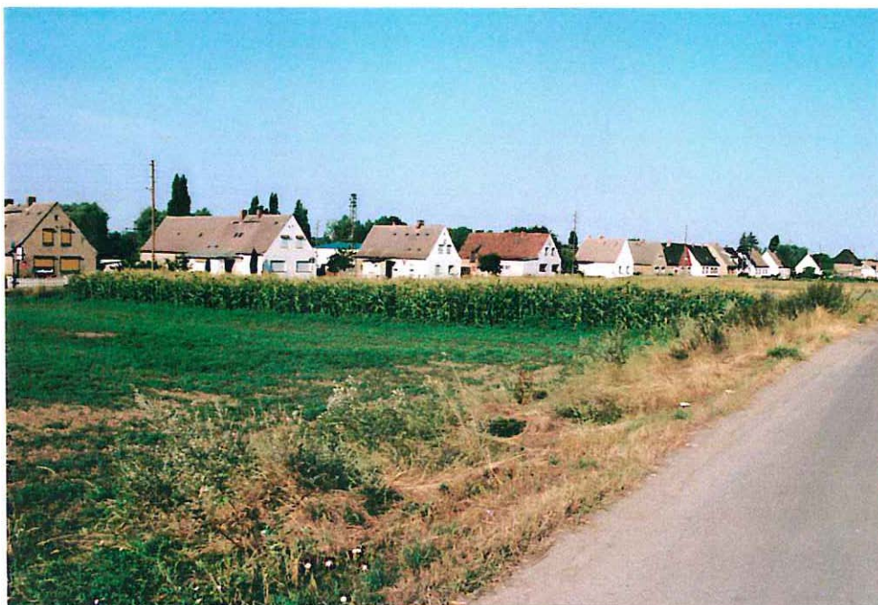
Abb.4: Kleinflächige Ackerschläge im Plangebiet, im Hintergrund einzeilige Häuserreihe an der B 185