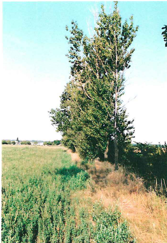
Abb. 6: Saumgesellschaft an der Bahnböschung (Strecke Bernburg-Güsten) mit Populus x canadensis